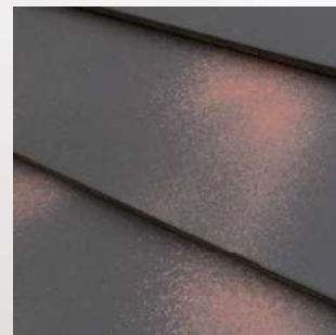
シェードブラウン