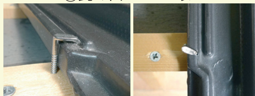
水返し部へ留め付ける