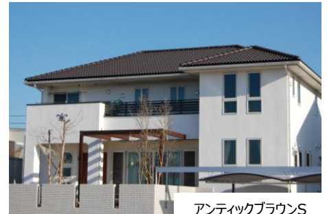
アンティクブラウンS