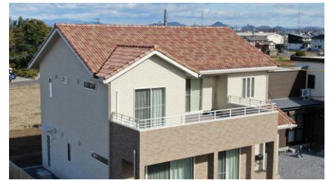
ティエラレッド1：ティエラアイロー1：ティエラホワイト1