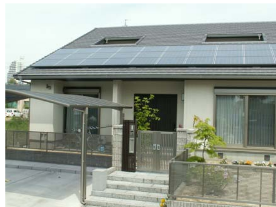
太陽光発電システムを搭載した住宅

さらに、当社は、商社の協力によって同社以外複数の太陽光発電システムについても取り扱いを開始し、屋根工事業者様に対しまして、流通システムの利便性をご提供できると考えております。