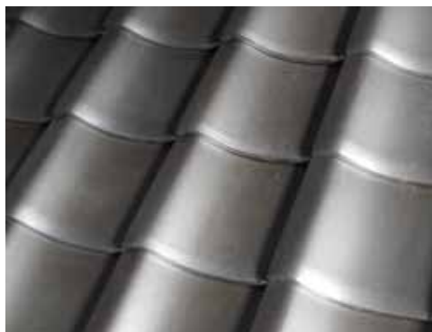
中央列が「 8.25 寸エース棧瓦」

エース棧瓦より 15mm( 5 分 )小さい棧瓦を開発。7.5 寸エース特棧瓦に比べ、棧瓦に寸法が近い為、葺き上がりにほとんど違和感がありません。