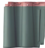
スーパートライ110 サンレイ