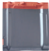
スーパートライ110 タイプ1