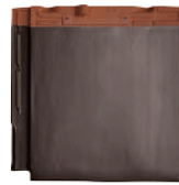
スーパートライ110 スマート